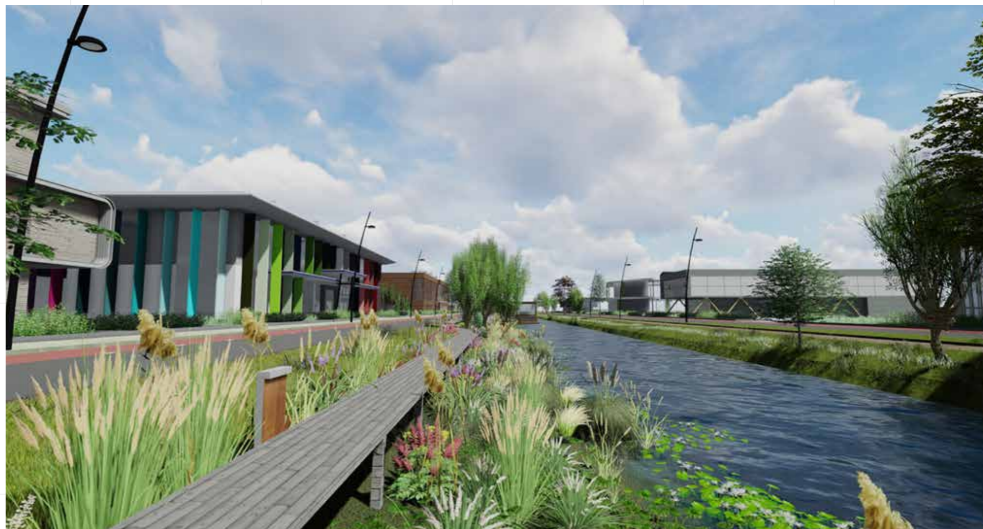
FOTO. Een impressie van de 40 meter lange ecologische tocht