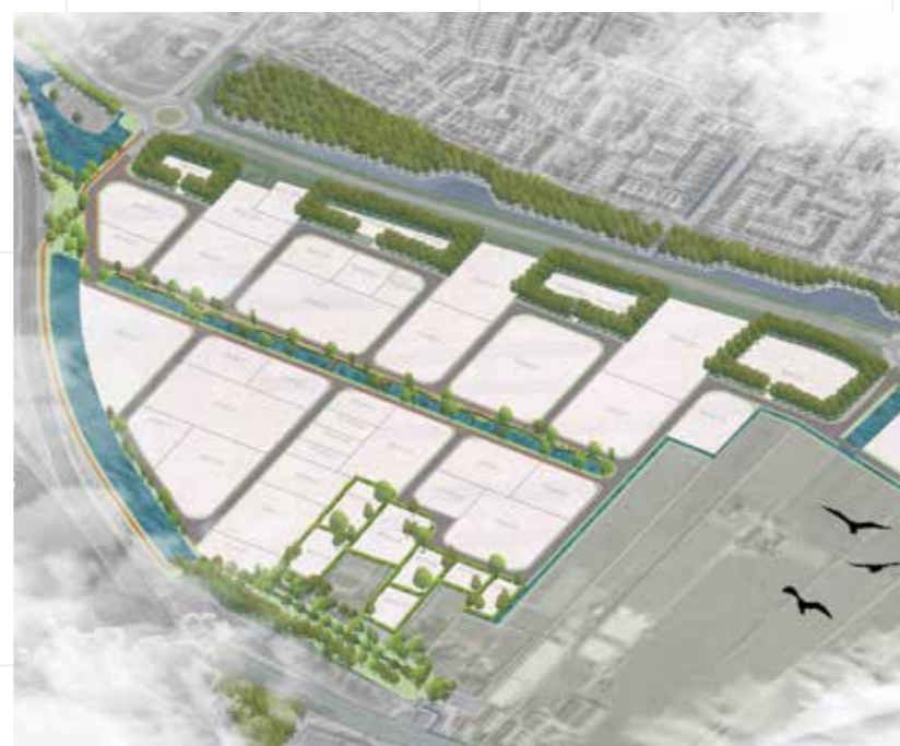
PLATTEGROND. De stedenbouwkundige plankaart van Ambachtsezoom

De ruggengraat van het circulaire bedrijventerrein in Hendrik-Ido-Ambacht is een 40 meter lange ecologische tocht die het groenblauwe hart van het plan vormt. Hier wordt het verkeer afgewikkeld en worden de circulaire uitgangspunten van het terrein 'beleefbaar' gemaakt. Met een natuurlijke oever wordt de biodiversiteit in het gebied verstevigd. De inrichting van het gebied met veel water en groen is aantrekkelijk voor verschillende dieren en planten. Het is een inspirerende, gezonde en prettige omgeving om te werken en te ontspannen.